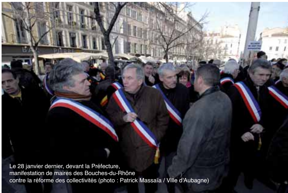
Le 28 janvier dernier, devant la Préfecture, manifestation de maires des Bouches-du-Rhône contre la réforme des collectivités

Donc pour le moment, rien n'est officiellement arrêté. Les 2 et 4 mars prochain, les Pennoises et les Pennois sont conviés à deux réunions publiques, au cours desquelles nous entrerons plus en détail sur l'ensemble des conséquences pour l'avenir, que renferme cette réforme des collectivités. Mais ce sera aussi l'occasion de réfléchir ensemble, aux moyens d'action à mettre en place dans cette bataille qui nous attend. Car nous avons besoin du soutien de tous, élus, citoyens, acteurs locaux, représentants associatifs, et c'est dans ce sens qu'à l'initiative de tous les maires de l'Agglo, un référendum portant sur la réforme sera organisé le 13 juin prochain, dans toutes les communes membres de notre communauté. J'invite donc à la plus large mobilisation, pour mener à son terme cette lutte légitime. Car 2010, est une année de résistance !